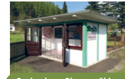
Rechenberg-Bienenmühle (am Ökobad)

Öffnungszeiten: Mo. & Di. Ruhetag Mi. bis Fr. 11:00 – 16:00 Uhr Sa., So. & Feiert. 11:00 – 17:00 Uhr zugänglich über Drehkreuz (Münzeinwurf 1,00 €)