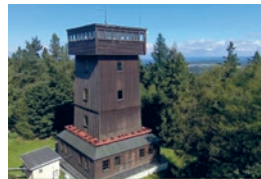
Kapellenberg (759 ü. NHN)

08648 Bad Brambach info@kapellenberg.de www.kapellenberg.de