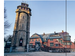
Auersbergturm (1.018 m ü. NHN)

Öffnungszeiten: ab 7.4.23 bis vorerst 25.6.23 jeden Sa, So und Feiertag von 10:00 – 17:00 Uhr geöffnet Eintrittspreis: Erw. 2 € | Kinder 1 €