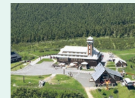
Fichtelbergturm (1.215 m ü. NHN)

Öffnungszeiten: öffentlich zugänglich über Drehkreuz (Münzeinwurf 1,00 €)