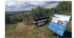
Swartenberg (787 m ü. NHN)

Öffnungszeiten: im Außenbereich öffentlich zugänglich