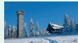
Aschbergturm (936 m ü. NHN)

Grenzweg (Nähe DJH Jugendherberge Klingenthal) 08248 Klingenthal Tel: 037465 45690